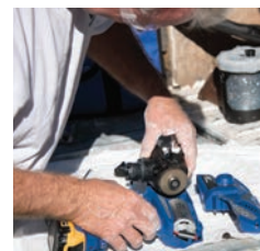
3. Vložte do zariadenia novú pumpu.