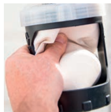
2. Vytlačte všetok vzduch