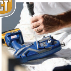
1. Odstráňte kryt skrutkovačom.