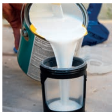
1. Naplňte vak FlexLiner™ materiálom