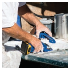
2. Odstráňte starú pumpu zo zariadenia.